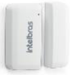
XAS 8000 Sensor de apertura magnético inalámbrico